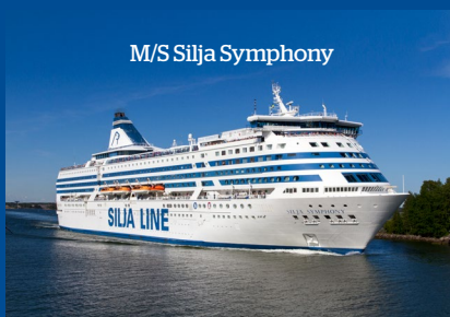
M/S Silja Symphony